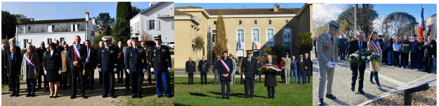
De gauche à droite, cérémonies du 15 novembre à Mont-de-Marsan, du 23 novembre à Dax et du 28 novembre à Biscarrosse.